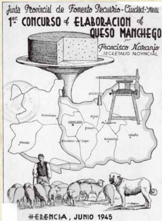
Figura 5. Portada de la memoria y reglamento del primer concurso de elaboración de Queso Manchego que se celebró en Herencia (1945).

En Herencia se celebró en 1945 el primer concurso de elaboración de queso Manchego (Figura 5), organizado por la Junta Provincial de Fomento Pecuario de la provincia. Figura destacada de este certamen fue D. Francisco Naranjo que ejercía la jefatura provincial de la Sección de Ganadería y Secretaría de la Junta. El reglamento del concurso era muy completo y contemplaba aspectos muy novedosos para la época como la higiene de la leche y del queso, las instalaciones de ganadería y quesería, etapas del procesado y la definición de las características organolépticas del producto terminado. Estos concursos contribuyeron de forma decisiva a la tipificación del Queso Manchego, que se materializó cuatro décadas después (1985) con el reconocimiento de