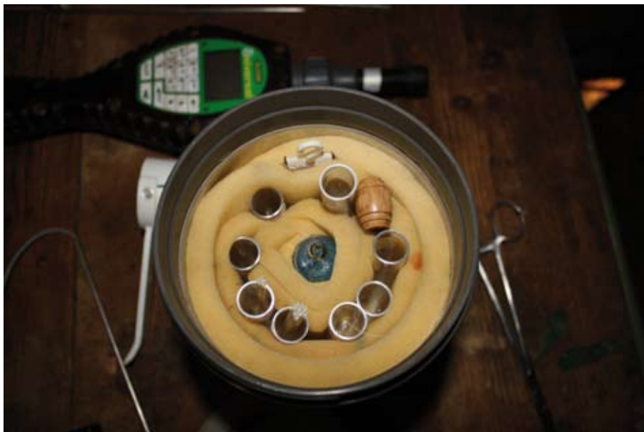
En esta imagen del interior del termo se puede observar la banda de goma espuma de poliuretano, alrededor de la que se disponen las dosis seminales, y la ampolla de ácido acético que, colocada en el centro, permite que la temperatura en el interior del termo se mantenga entre 15 y 16° C.

En Roquefort, las ovejas Lacaune no se ordeñan inmediatamente después de la IA, debido a que durante el ordeño