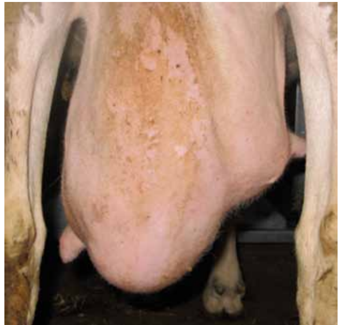
Las asimetrías observadas son resultado de pérdida de tejido mamario por lesión, bien de infecciones pasadas o presentes en el momento.

Relacionando las lesiones observadas con los datos individuales de RCS del C.L.O., se constató que, en el caso de asimetrías, el 45% de las hembras con esta lesión mostraban recuentos superiores al millón de células/ml. Un 13,7 % de las hembras en las que se detectaron nodulaciones también superaban ese umbral y un 6% de las hembras que presentaban bultos en una o ambas mamas.