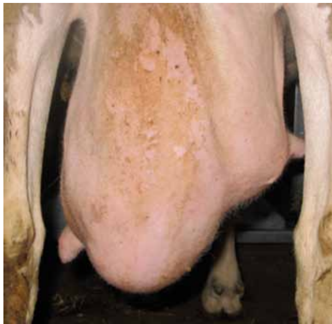
Las asimetrías observadas son resultado de pérdida de tejido mamario por lesión, bien de infecciones pasadas o presentes en el momento.

Relacionando las lesiones observadas con los datos individuales de RCS del C.L.O., se constató que, en el caso de asimetrías, el 45% de las hembras con esta lesión mostraban recuentos superiores al millón de células/ml. Un 13,7 % de las hembras en las que se detectaron nodulaciones también superaban ese umbral y un 6% de las hembras que presentaban bultos en una o ambas mamas.